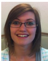
Marie Aide Médico Psychologique